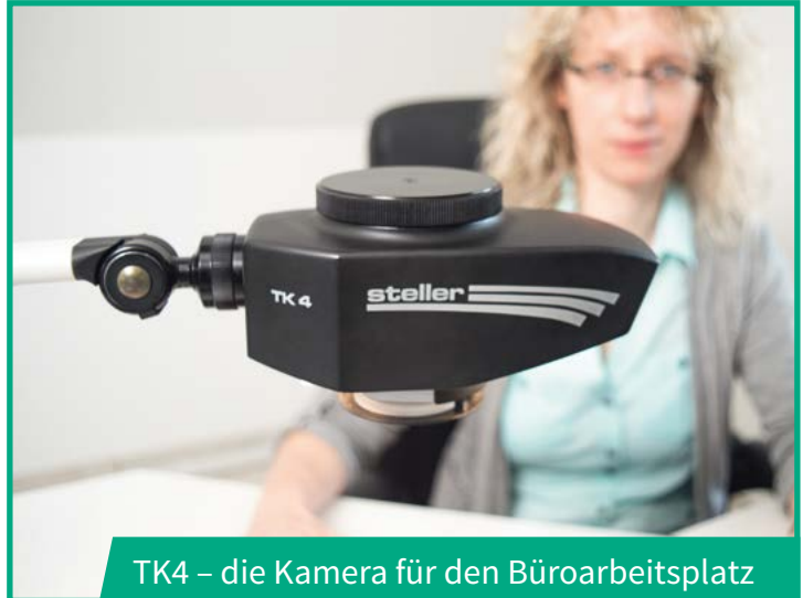
TK4 – die Kamera für den Büroarbeitsplatz

Im Kamerakopf ist eine flimmerfreie LED-Beleuchtung integriert. Mit der optional erweiterbaren, mikroprozessorgesteuerten SL1-Komponente können zusätzlich Helligkeit und Farbtemperatur – nahezu das komplette Weißspektrum wird abgedeckt – stufenlos geregelt werden.