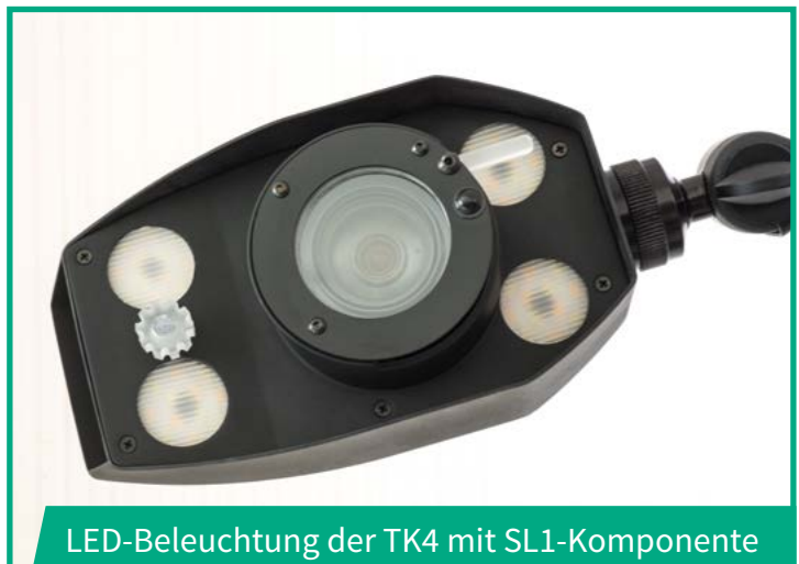
LED-Beleuchtung der TK4 mit SL1-Komponente