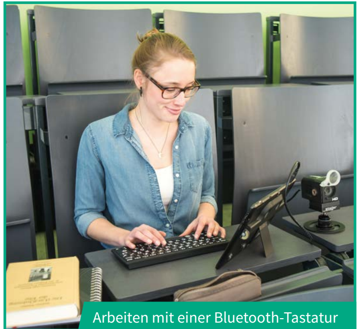
Arbeiten mit einer Bluetooth-Tastatur

Das Grundsystem steller Vision Tab besteht aus einem Tablet und einer Kamera der PK6-Serie. Diese kann wahlweise mit einem Tischstativ oder einem Magnetschwenkarm kombiniert werden. Wird das steller Vision Tab mit einer zweiten Minikamera ausgestattet, kann diese an einer Kameraschiene befestigt oder mit einem Handstativ zum besseren Lesen benutzt werden. Mit einer Bluetooth-Tastatur mit Großschrift werden beispielsweise Hausarbeiten verfasst. Und mit einer zusätzlichen Akku Extension (Powerbank) erhöht sich die Akkulaufzeit um bis zu zehn Stunden.