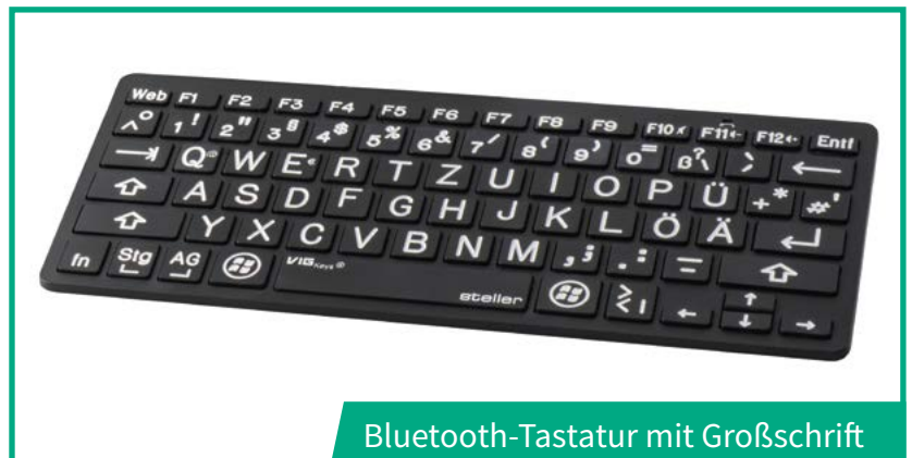
Bluetooth-Tastatur mit Großschrift