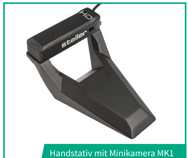
Handstativ mit Minikamera MK1