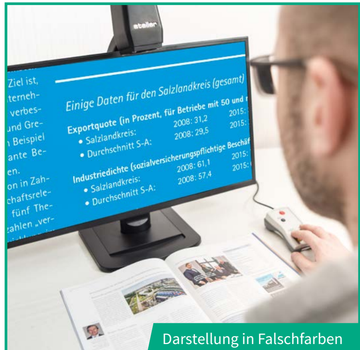
Darstellung in Falschfarben

Liebgewonnene Hobbies wie das Lesen von Romanen oder das Lösen von Kreuzworträtseln werden mit der steller SK1 wieder problemlos möglich; aber auch das Lesen wichtiger Briefe, das Ausfüllen von Formularen oder das Anschauen von Fotos. Die Bedienung des Gerätes ist einfach und erfolgt intuitiv. Mit dem übersichtlichen steller Control werden verschiedene Farbmodi, die stufenlose Vergrößerung, die Schärfe und der Kontrast geregelt. Persönliche Profile können schnell gespeichert und abgerufen werden. Übrigens erscheint mit der integrierten Beleuchtung alles im perfekten Licht – auch am Abend.